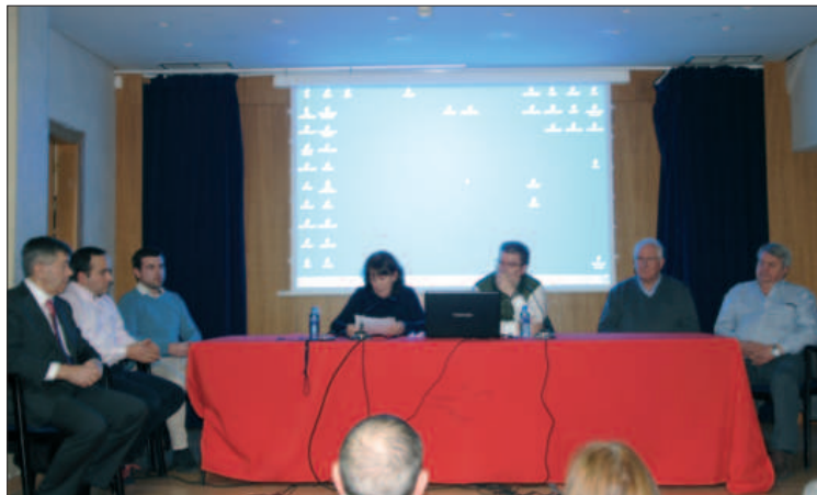
Varios alcaldes de Las Merindades asistieron a la charla.

El desarrollo de la comarca pasa por una infraestructura de esas características, un tema sobre el que prácticamente la totalidad de