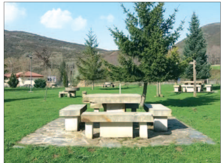
Se plantarán árboles en el paseo que lleva a la zona de Las Cocinas.

Próximamente se comenzarán las obras del parking para caravanas, que como ahora se encuentra en mal estado.