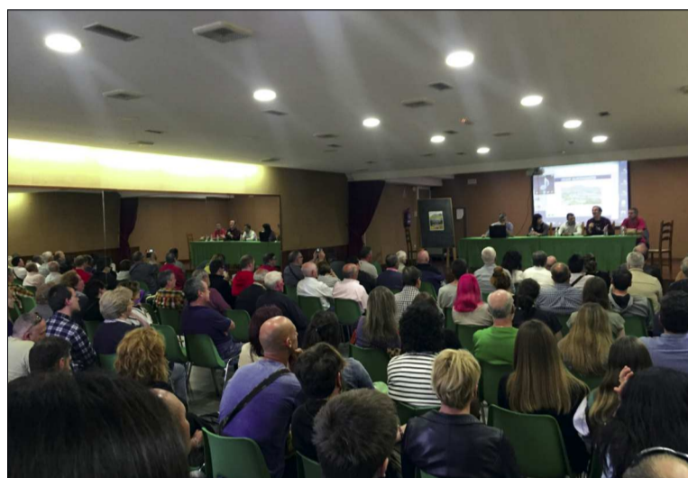
Cerca de 200 personas asistieron a la reunión informativa celebrada el pasado mes de junio en Quintana Martín Galíndez

Actualmente el proyecto ha conseguido permiso de exploración por parte de la Junta de Castilla y León y está previsto que se comiencen a ejecutar por la empresa, Asfibusa (perteneciente al Holding Yarritu), diversas catas sobre el terreno.