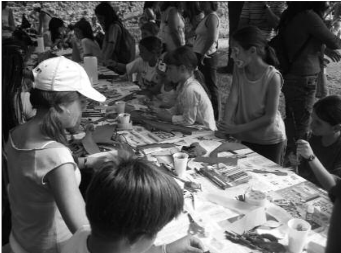
► Los niños meneses participan en una actividad educativa

Por otro lado y dentro del mismo proyecto destaca la participación de 10 chicas y 5 chicos en la realización de la revista "Valle Moviada", los 22 jóvenes que han participado en una Charla de Acceso al Empleo organizada por