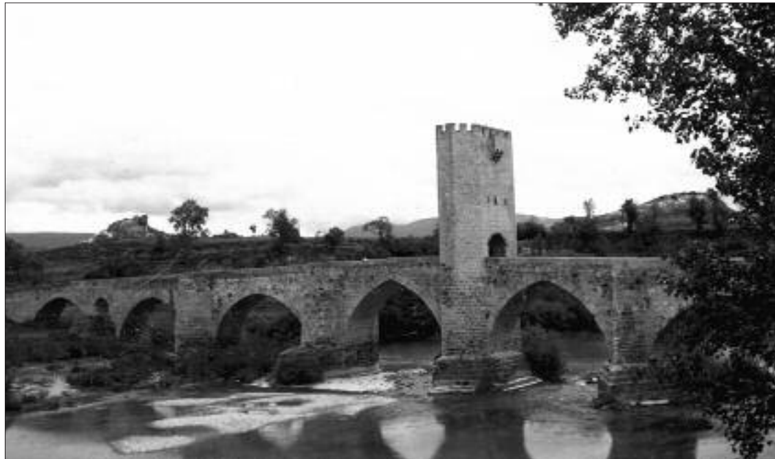
► El puente medieval de Frías tuvo un peso importante en las intervenciones de Longa.

rate del periódico Crónica de Las Merindades, uno de esos personajes que escogieron estas tierras para sus hazañas. Vamos a tratar de trazar una breve semblanza de Francisco Tomás Anchía, más conocido como general Francisco Longa, uno de los más afamados jefes guerrilleros durante los últimos años de la Guerra de la