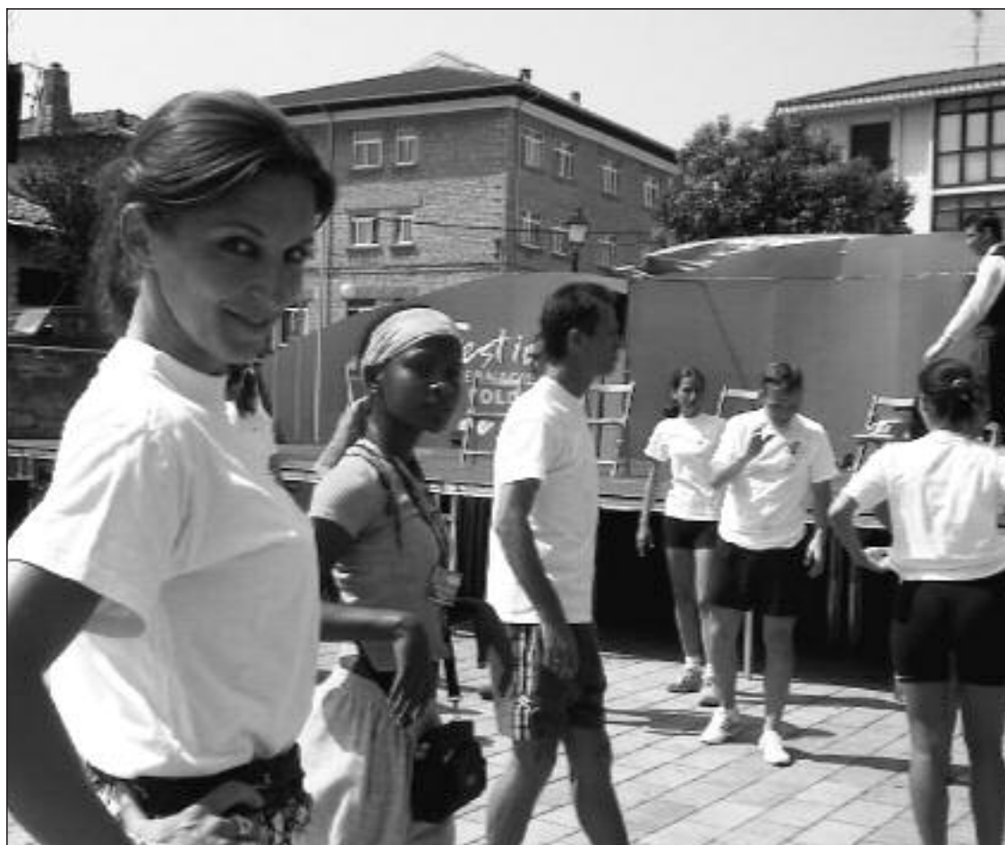
► Los talleres de teatro que se celebran a mediodía son un punto de encuentro entre artistas vecinos de Mena

La Sección de Promoción Artística del Servicio de Promoción cultural de la Dirección General de la Juventud montará para el día 1 de agosto a las 12 horas una jaima en la Plaza San Antonio, con información para jóvenes y desde 17 a las 20 horas habrá