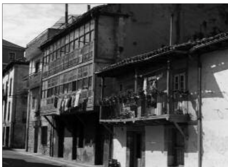
► El caso urbano de Villarçayo fue refugio de Longa en la guerra Napoleónica.

Fue Longa un personaje a imitar, valiente, astuto, equilibradamente temerario y, sobre todo, un patriota de tomo y lomo, que bien merecería figurar dando nombre a una de esas numerosas calles nuevas que se abren por doquier en las villas, pueblos y aldeas de Las Merindades.