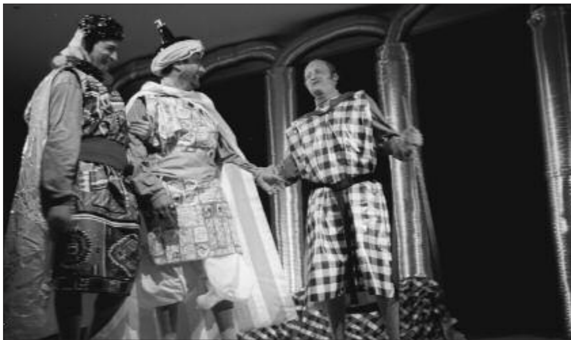
► El teatro tiene una especial relevancia en el programa de agosto.

Desde su formación, en 1994, el Grupo de Danzas, Coros y Canto "Talaka", de la