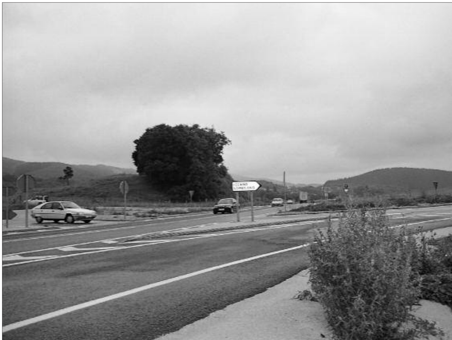
► El nudo de Paradores-Vivanco es uno de los más conflictivos del trazado

La construcción del resto del trazado hasta Bercedo no creó tantas polémicas aun cuando en el invierno de 2003 se hizo necesario cerrar al tráfico parte del recién inaugurado trazado de la carretera a su paso por Irús a causa de un desprendimiento en uno de los muros de contención.