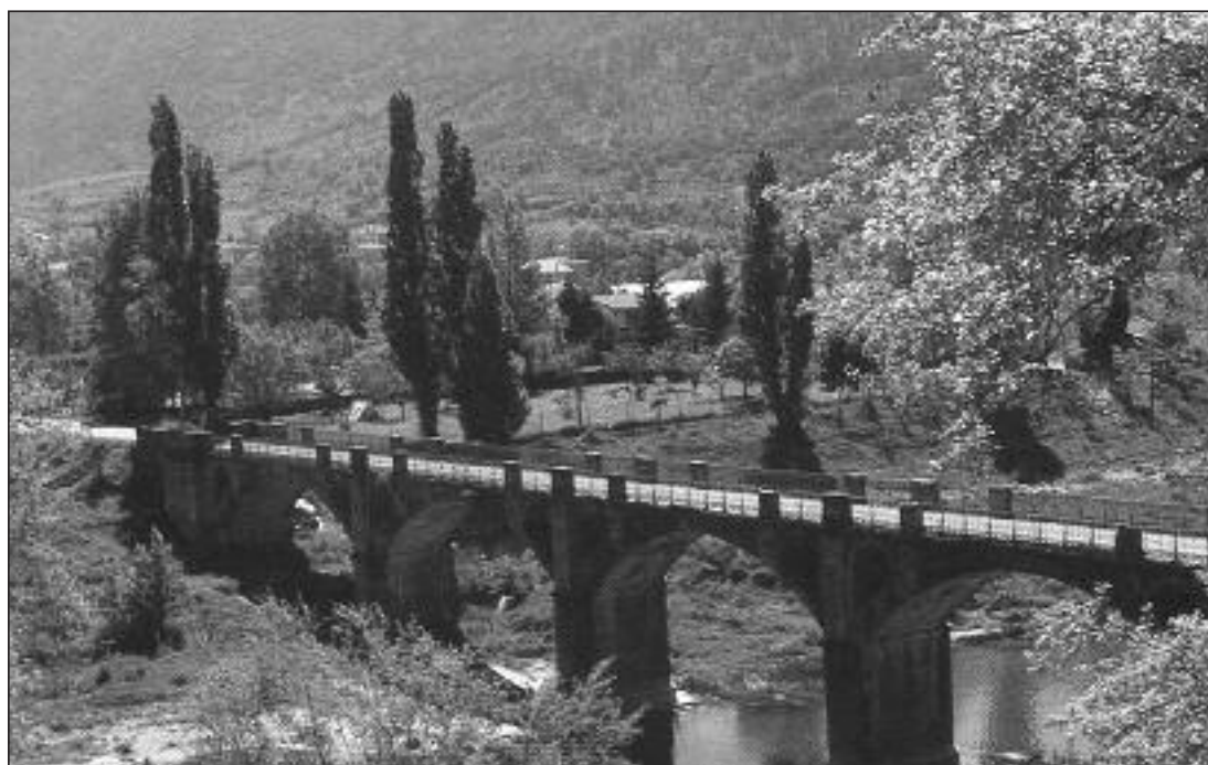
► El río Ebro a su paso por Montejo de Cebas

sa inscripción y cuyo plazo se cierra el viernes 18 de agosto.