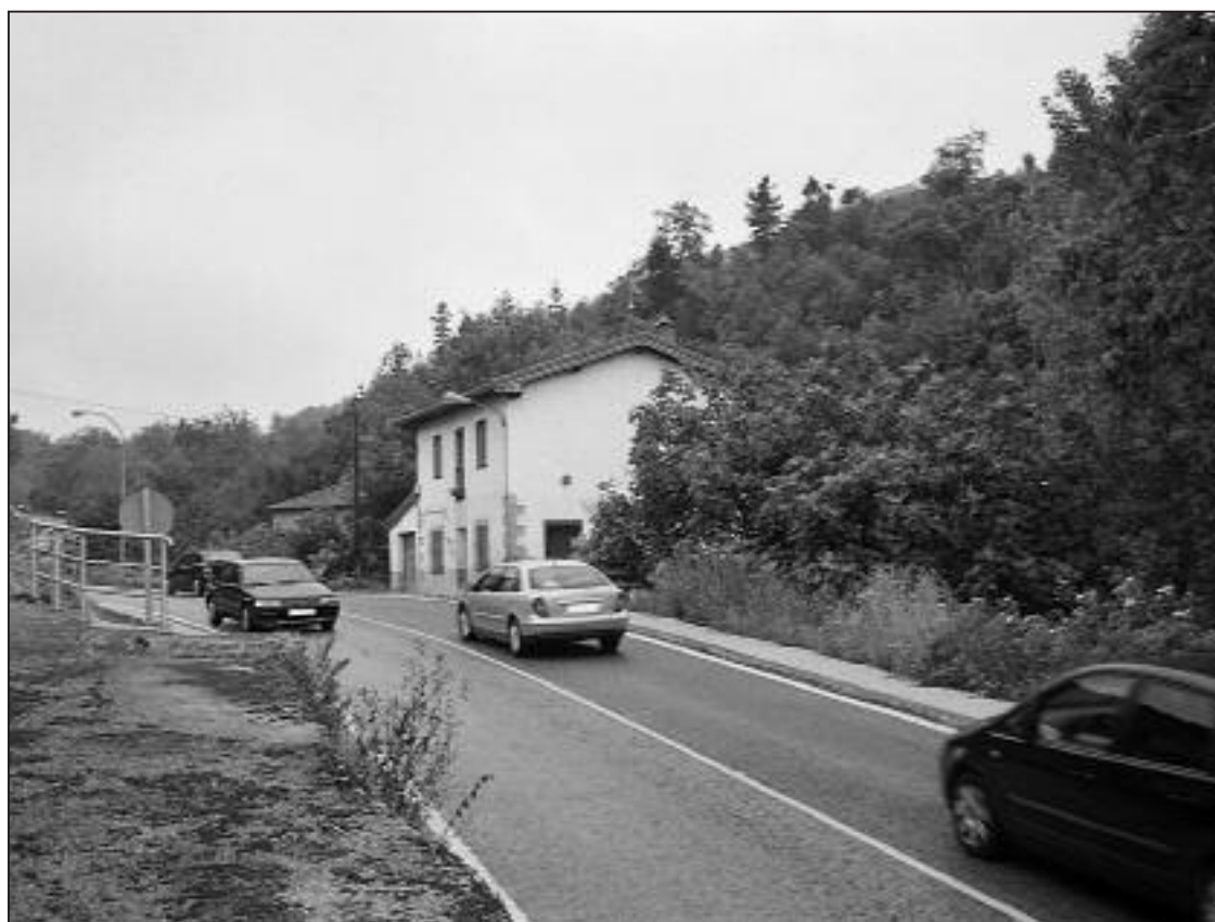
► El paso por Vivanco resulta muy estrecho y está en una curva

A estas fechas la peligrosidad del trazado continúa sin resolverse a pesar de que el Ayuntamiento instó a la Junta