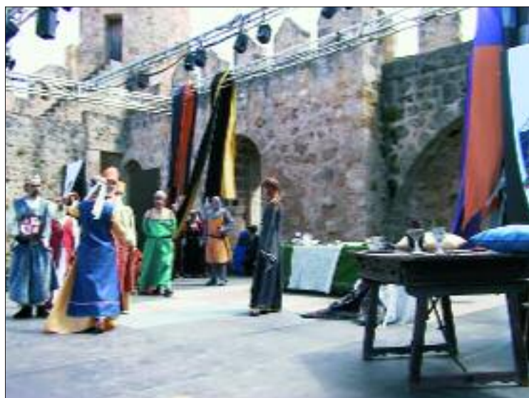
► Los textos de las obras son redactados por los propios actores

A las 10 de la mañana se inaugura el XXII Concurso Hortícola y Artesanal que se celebra en la calle y Plaza del Mercado. A las 13.00 horas se entregan los premios a los ganadores.