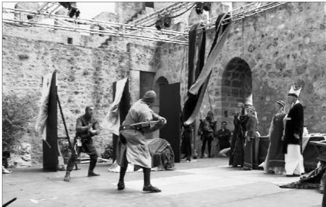
► Recreación del otorgamiento del Fuero a Frías

Los actos principales se desarrollan el jueves 3 a las 11 de la noche en el patio de armas del Castillo con la representación del Capitán, y el sábado 5 en