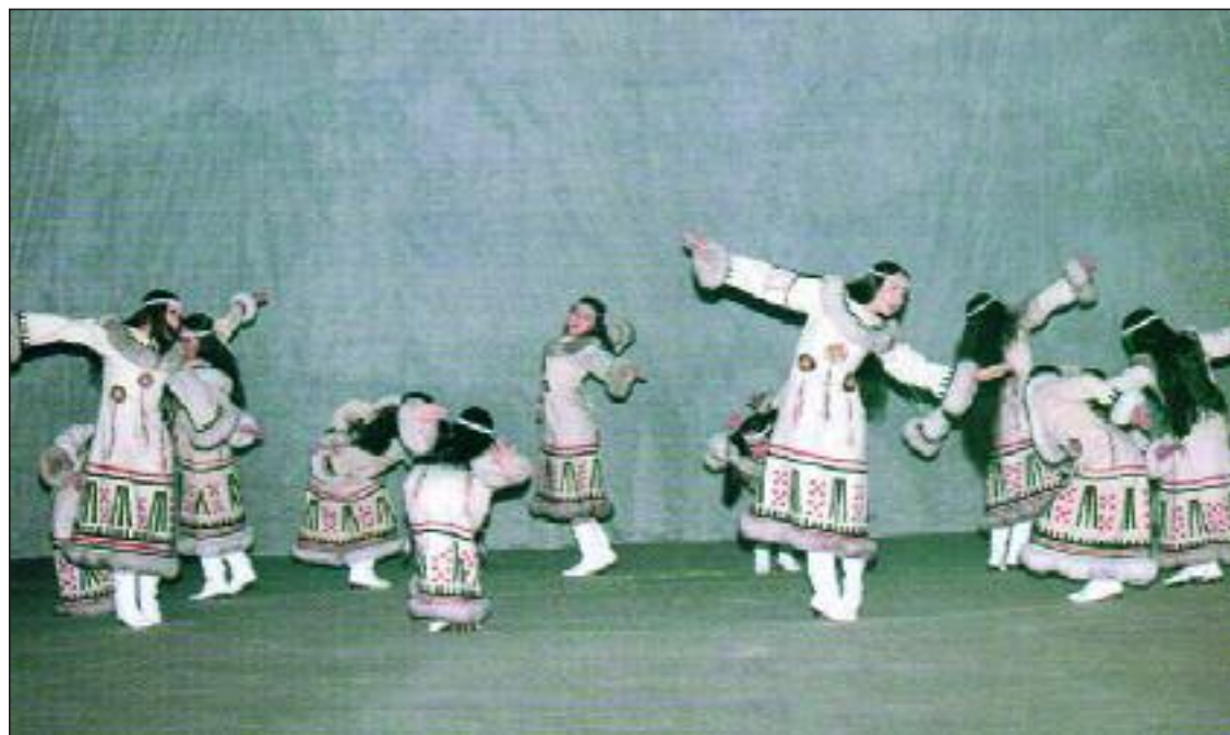
► Bello cuadro plástico formado por el Grupo de Esquimales