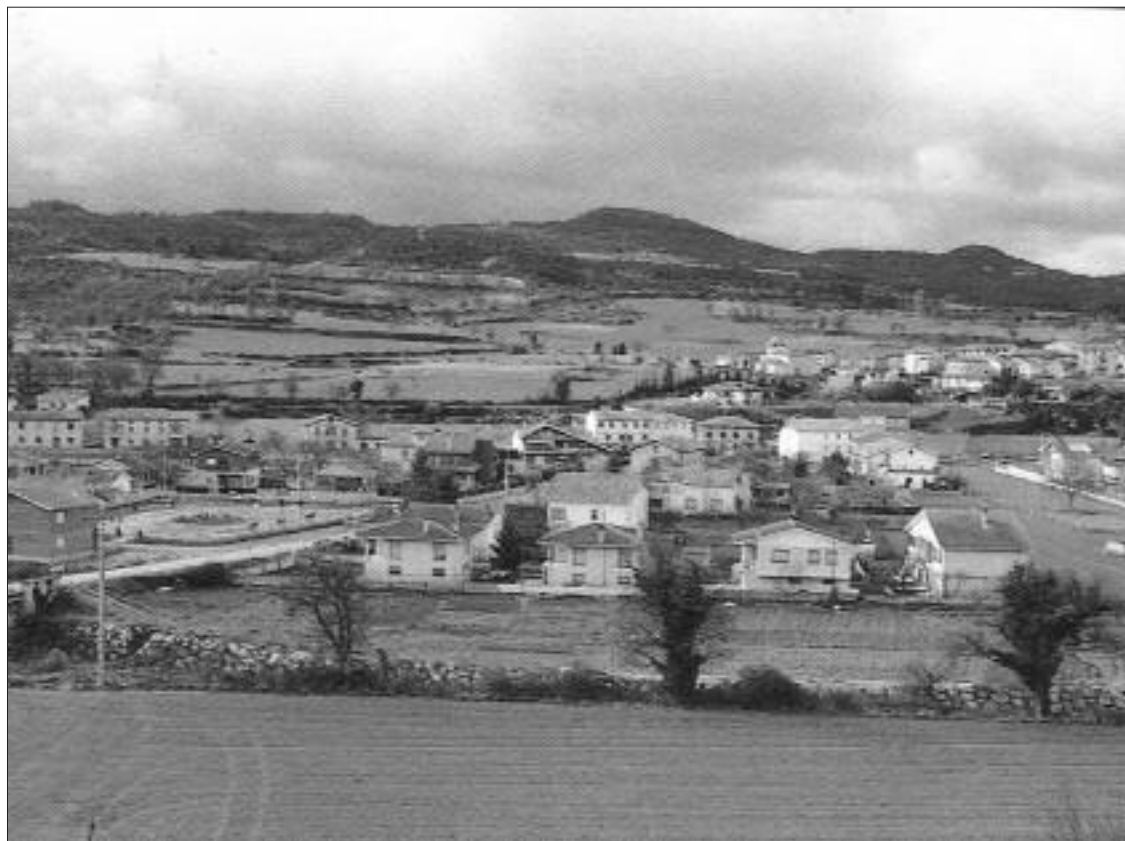
► Pedrosa y la Orden

Para el sábado 5 de agosto la Asociación "Amigos de San Martín de Don" ha organizado una Jornada de Convi-