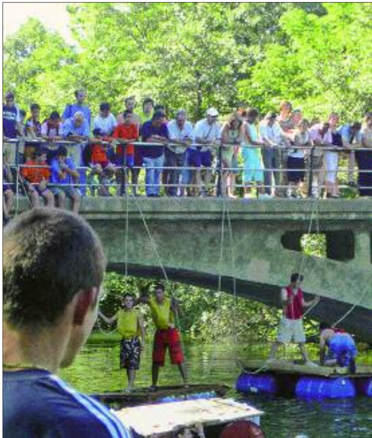
► Batalla Naval en el río Nela

Por otro lado, los días 24, 25, 26 y 27 de agosto se celebra el Concurso Nacional de Saltos Hípicos, Categoría C y el 31 de agosto al 3 de septiembre se celebra el VI Concurso Morfológico-Funcional de caballos y yeguas de Pura Raza Española.