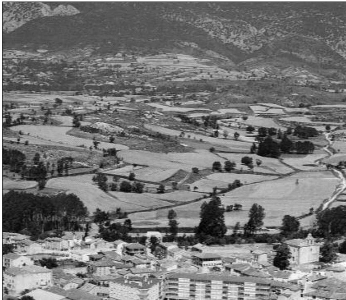
► Quintana Martín Galíndez, capital del Valle de Tobalina

Para el día 4 la Concejalía de Cultura ha organizado una excursión para presenciar en directo el programa de ETB2 "Esta es mi Gente". Los inte-