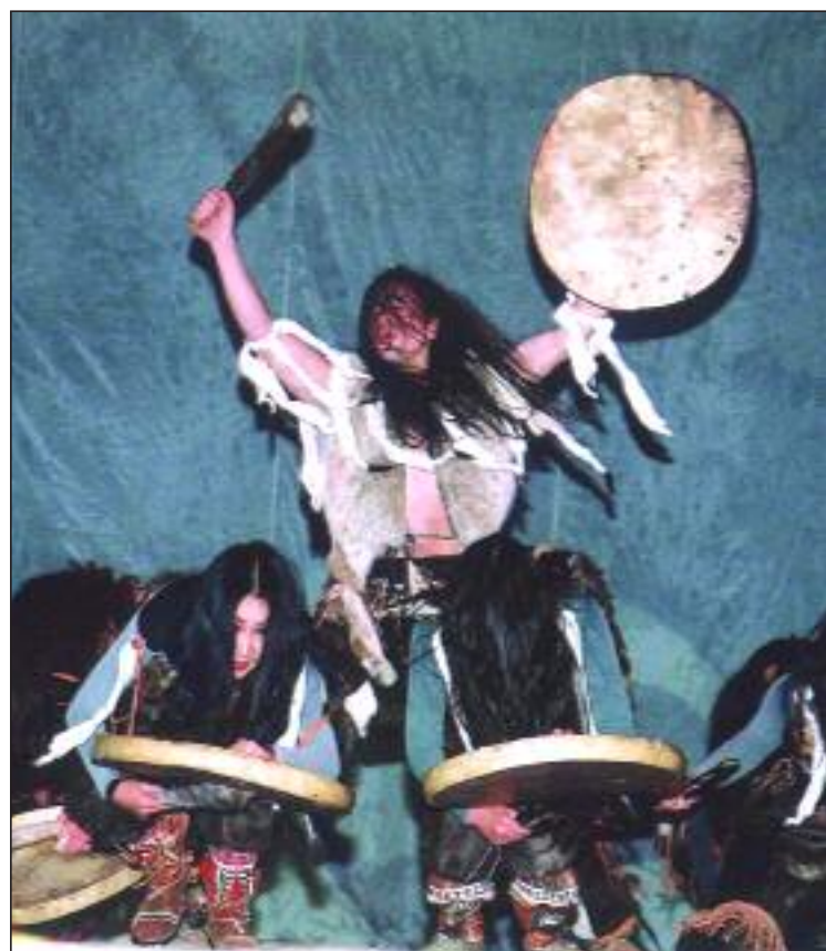
► Danzantes del norte de Rusia

12.00 h. "Danzas del Mundo". Taller de Danza realizado por el Grupo Folclórico "Vesennye Zori" ciudad Voronezh, Rusia. Lugar: Plaza