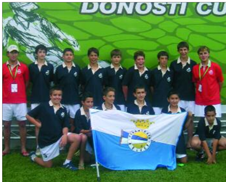
► Los componentes del equipo infantil estuvieron a punto de ganar la final de consolación.

tentos y con ilusión de cara al futuro, primero por tener la oportunidad de participar en un Torneo de esta categoría y, segundo, por los resultados conseguidos ante equipos de un nivel muy alto para estas edades, según señalaba uno de los acompañantes, padre concretamente, de uno de los jugadores.