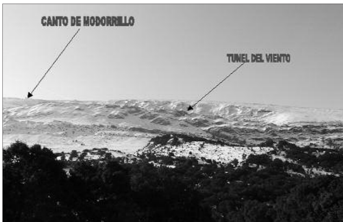
► Vista de la Tesla

Solo queda seguir hacia la izquierda por toda la meseta cimera hasta la peña la corva que se encuentra a unos 2 km por el cordal.