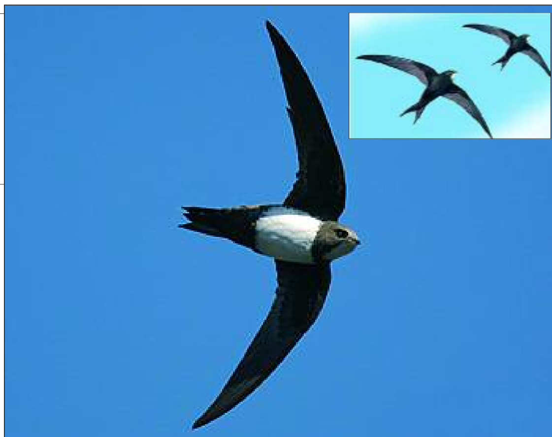
► Vencejo Real

Los vencejos llegan desde África a Las Merindades a finales de Abril-primeros de Mayo y nos abandonan en