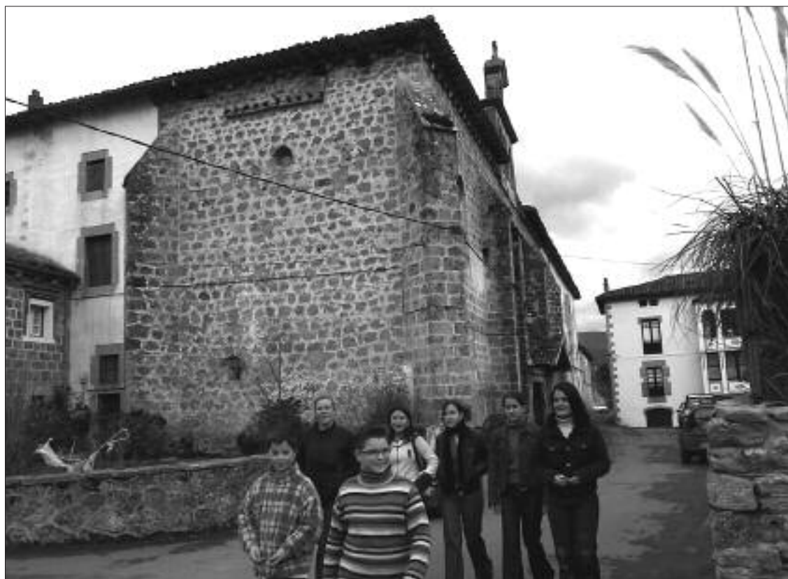
► Los jóvenes están participando activamente en el Plan de Dinamización Juvenil

La última noticia al respecto será la presencia en Mena, durante la primera quincena de agosto, de técnicos de la Dirección de Juventud para conocer de cerca el Plan que por su metodología constituye una iniciativa "innovadora" en Castilla y León y que sitúa al Valle de Mena en la vanguardia de las políticas de Juventud.