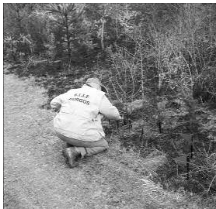
► Un Agente de la BIIF busca pistas en un incendio provocado