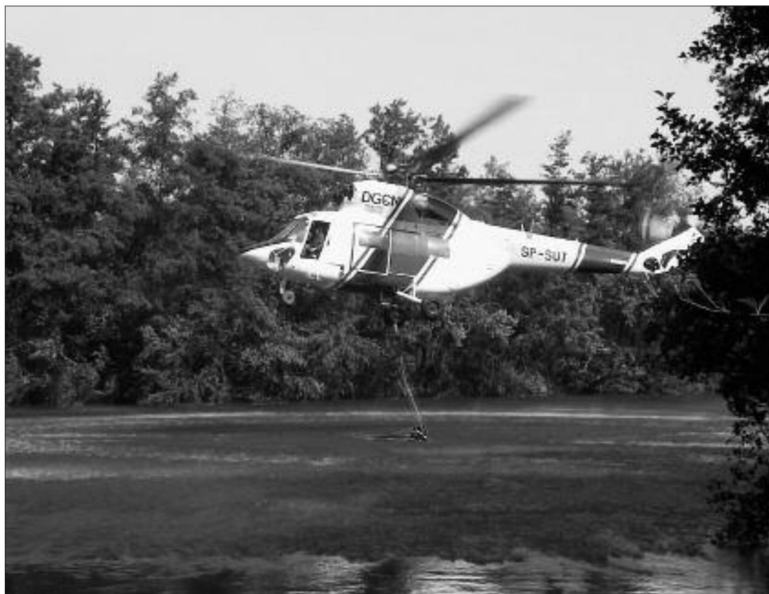
► Un helicóptero carga agua en el río Nela

Apunta Muñoz que este tipo de denuncias "se ha convertido en cosa seria", pues el denunciado deberá abonar los gastos de la extinción, por lo que la chuletada le puede costar más cara de lo previsto a quien ha encendido un fuego