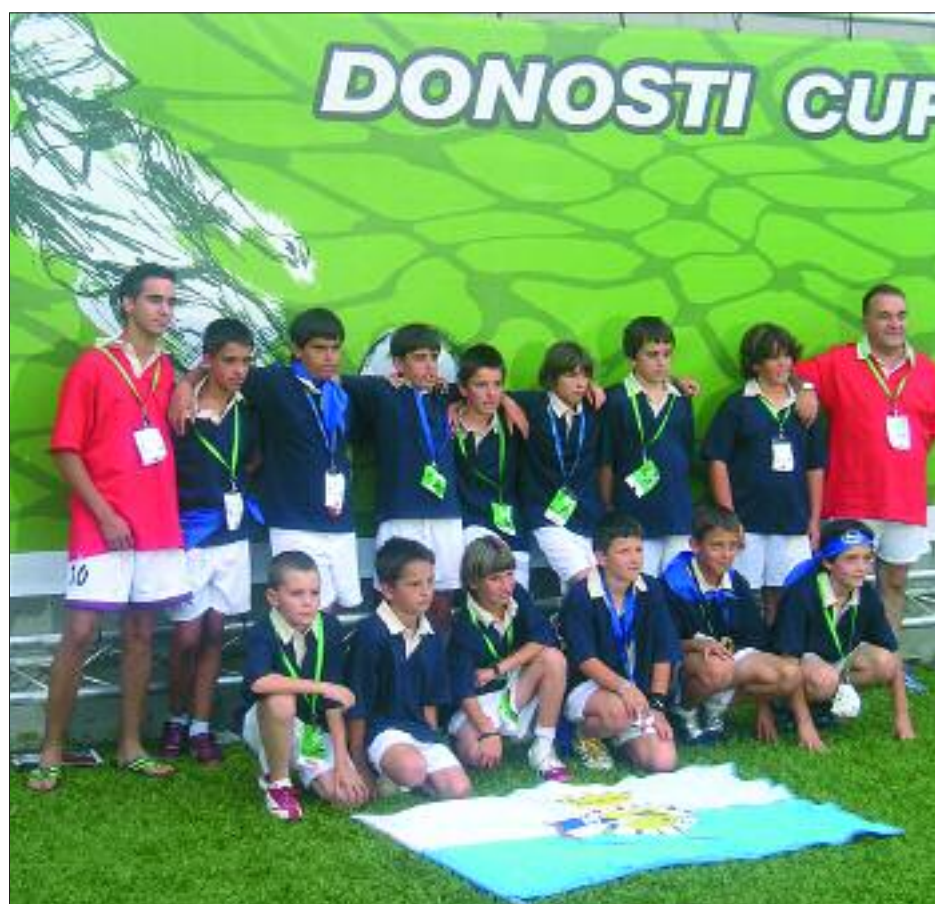
► Los más pequeños se lo pasaron en grande.

Los jugadores, técnicos y acompañantes regresaron a Villarcayo con-