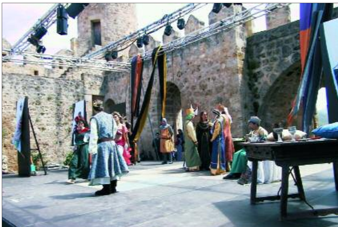
► El castillo medieval es un excelente marco para las representaciones

El 19 de agosto, sábado, en el patio de armas del Castillo se celebra la XXXIV edición de