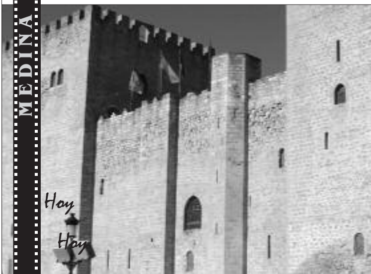
Alcazar de los Condestable