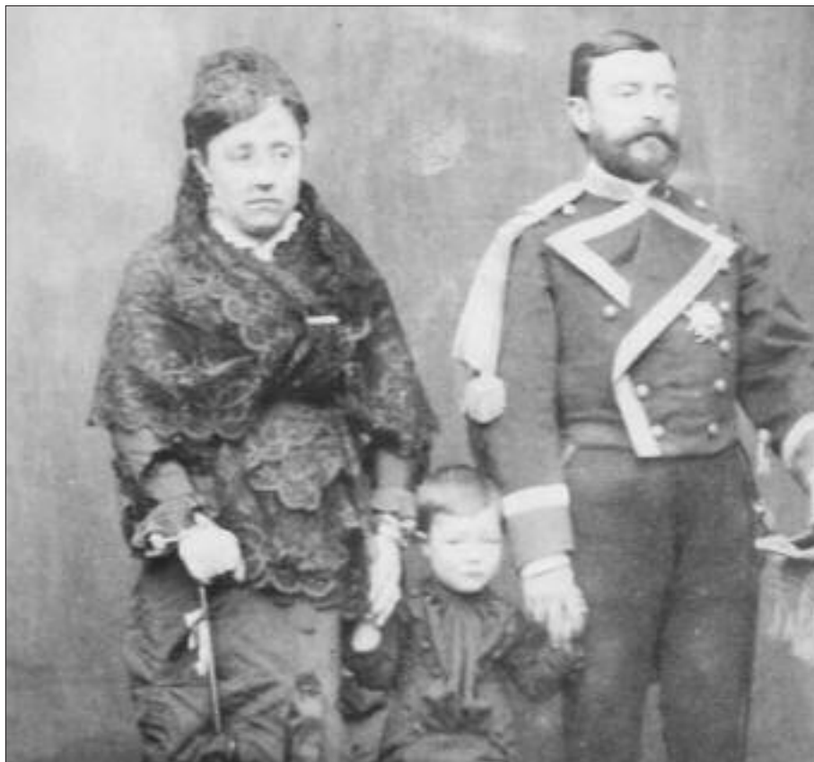
► Montero del rey con su familia