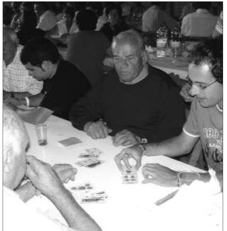
► Los juegos de cartas fueron muy disputados

Más tarde llegaron los juegos tradicionales donde las damas dominaron en el juego de la brisca, no así en el mus donde los varones ganaban