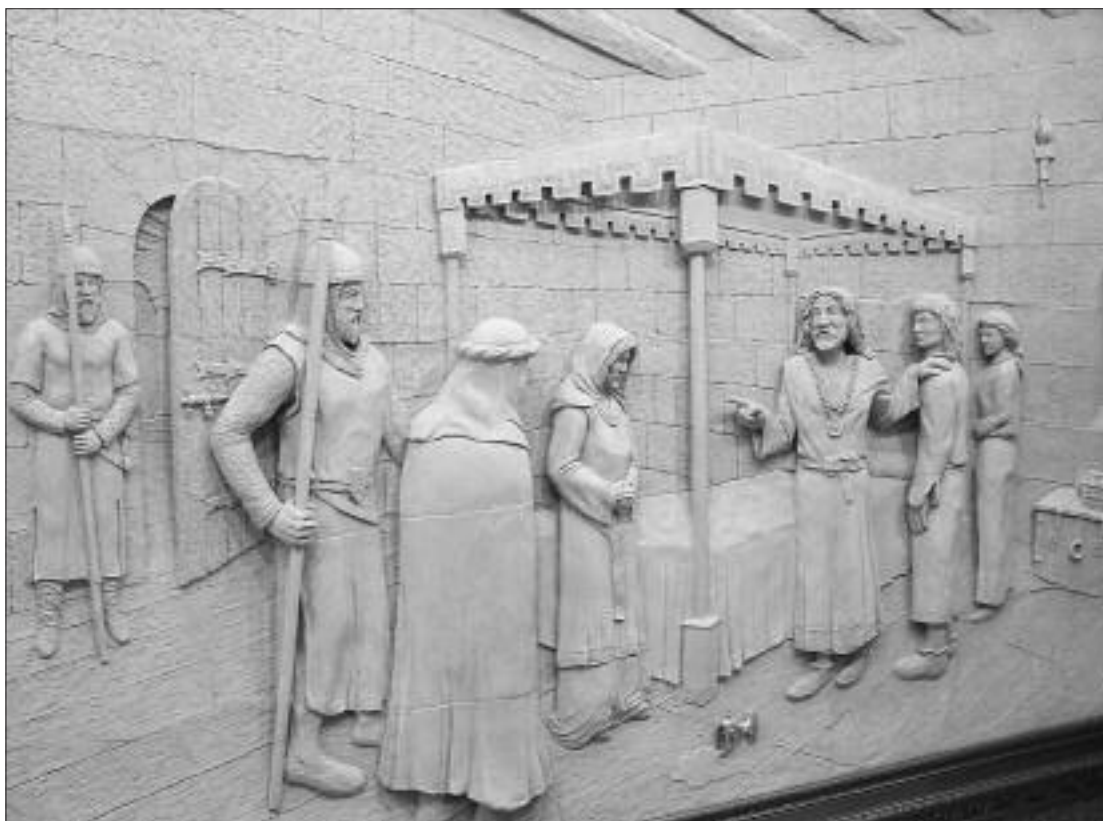
► Relieve alegórico a la creación del Cuerpo de Guardia del rey

■ Con la celebración del I Milenio de la creación del Cuerpo de Cámara de los Monteros del Rey celebrado en junio y julio de 2006 en Espinosa de los Monteros se inauguró a su vez el Museo que lleva el nombre de la institución, habilitado en el edificio que fuera hasta hace poco tiempo el Colegio del Pedrero al que asistían los más pequeños de la Villa.