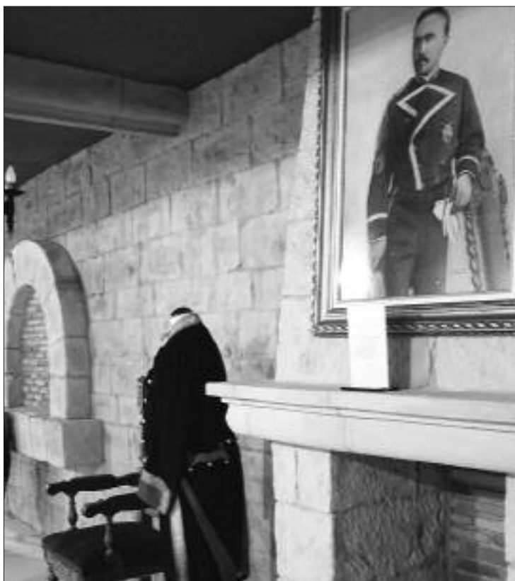
► Conjunto de fotografía de un Montero y uniforme, en el Museo de los Monteros en Espinosa