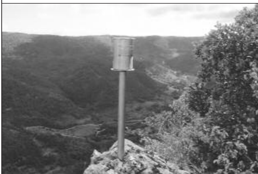
■ Buzón de la Peña del Agujero, 1.073 m