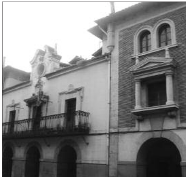
Ayuntamiento del Valle de Mena

La información contenida en algunos de los documentos registrados en años anteriores, ha permitido a los responsables locales de turismo abordar la datación e interpretación de caminos históricos que discurren por el territorio y que fueron vitales para el comercio de la lana y otras mercaderías procedentes tanto de la Meseta Castellana como de los puertos del Cantábrico.