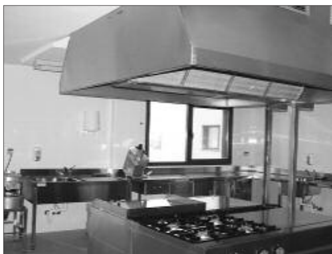
► Instalaciones de lavandería y cocina