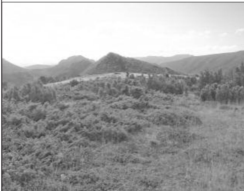
■ Agujero desde altollano