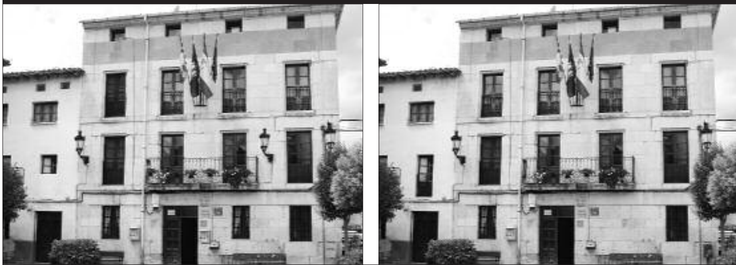
LOS 7 ERRORES