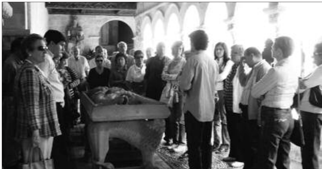
► La embajada Velasco escucha las explicaciones del guía en el Monasterio de Silos

Desde la Asociación Amigos de Medina de Pomar manifestaron su satisfacción por el desarrollo del encuentro