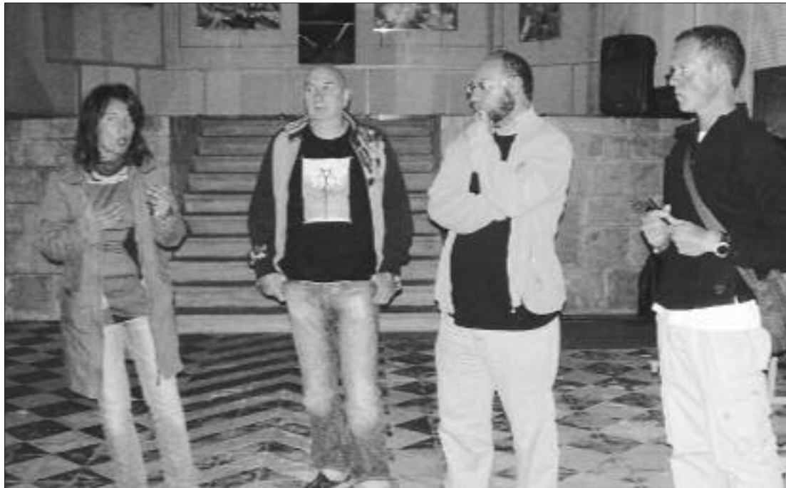
► Los autores de la obra en el centro, flanqueados por el concejal de Cultura y una técnico de la Oficina de Turismo

En enero de 2005, los dos artistas, vinculados a la facultad de Bellas Artes de la UPV, realizaron un vertiginoso periplo entre la ciudad de Bilbao y la hacienda Bilbao en Sevilla. En sólo tres días y siguiendo la ruta sur-suroeste, recorrieron los 1.000 kilómetros que separan ambos lugares, documentando mediante fotos, grabaciones de vídeo, recogiendo "muestras", realizando entrevistas... de su paso por los pueblos carreteras y paisajes de