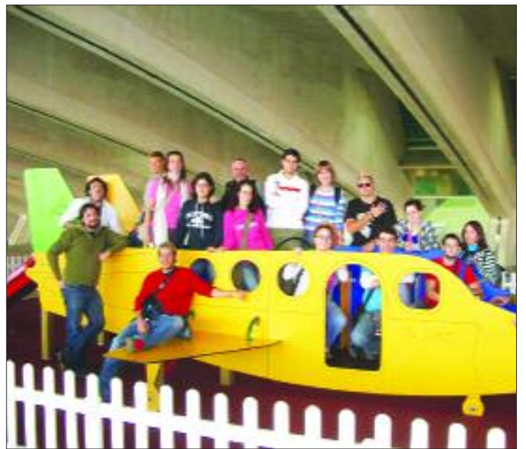
Un grupo de meneses durante un viaje similar celebrado el pasado año a Ucrania.

de bienvenida,...es decir, un sin fin de actividades que seguramente les resultarán inolvidables.