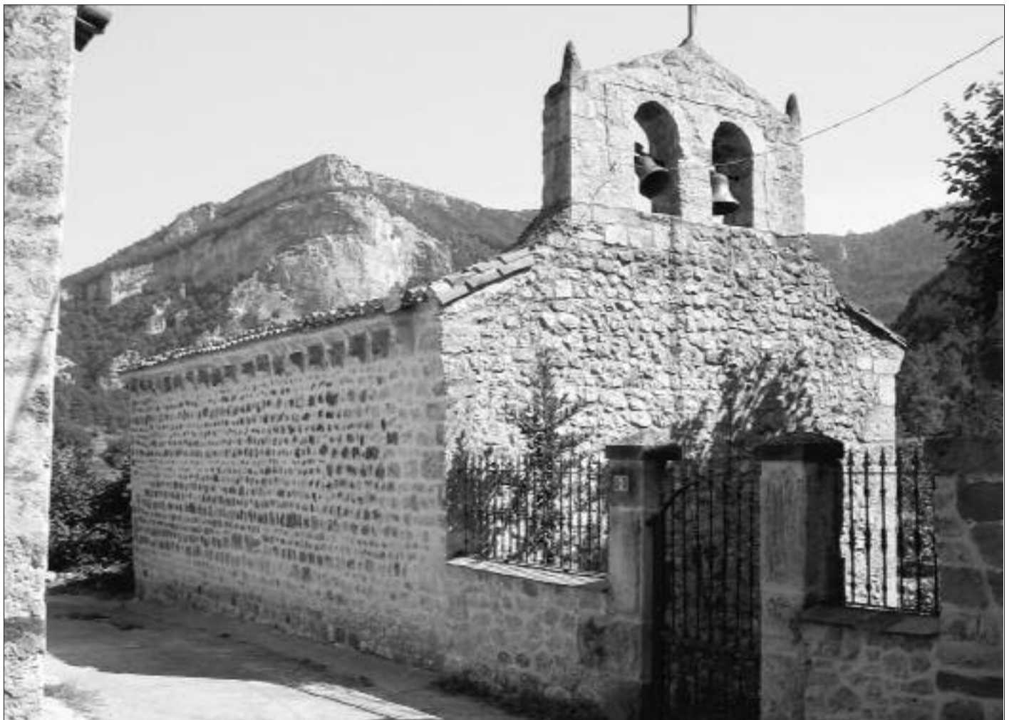
► Iglesia parroquial bajo la advocación de San Martín

Pamplona y Tartalés de Cilla están más unidas de lo que parece gracias a San Fermín