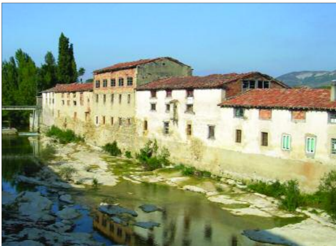
► Edificios en los que se curtía el cuero "Planchister" para cerner el trigo

En esta ocasión retrocedemos a Torres, última localidad que baña el salón, para continuar con la historia del mismo río al que le ha salido un cauce a modo de injerto y que se origina en una presa situada en el mismo casco urbano de este núcleo. Este cauce también movió molinos harineros y talleres de curtidores de cuero, de la misma manera que sirvió, y todavía lo hace, para regar las huertas de Villacomparada, tema del que trataremos en otra oca-