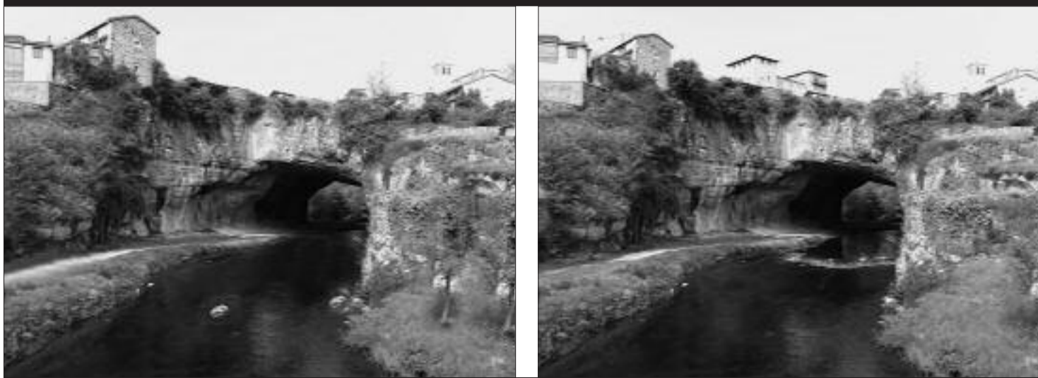
LOS 8 ERRORES