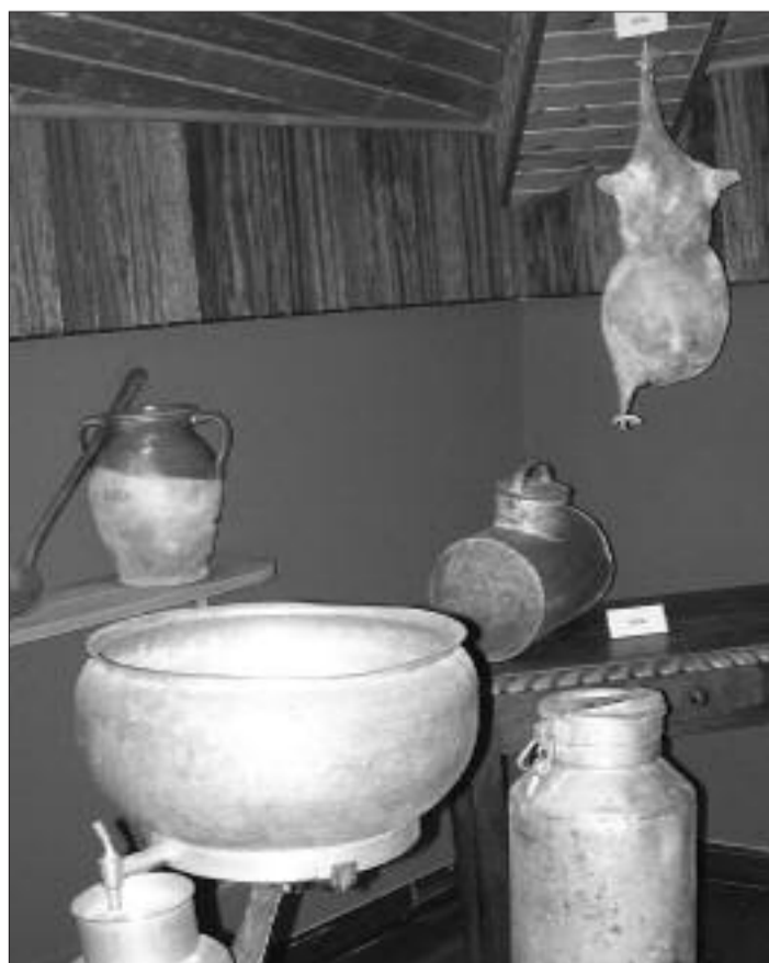
► Utensilios dedicados a manipular la leche

En la zona destinada a la carpintería se muestran he-