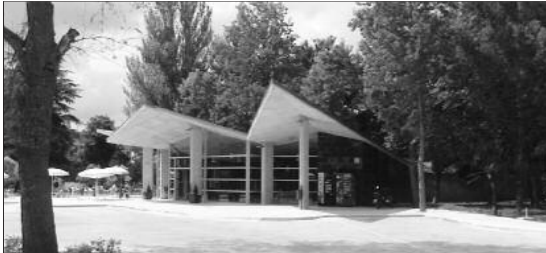
► Nueva estación de autobuses de Villarcayo

El presidente de la Junta de Castilla y León, Juan Vicente Herrera, ha inaugurado esta mañana la nueva Terminal de Autobuses en Villarcayo.