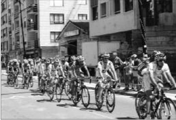
► La carrera a su paso por Villarcayo

Kunitski vence en la primera etapa de la Vuelta a Burgos disputada entre Medina de Pomar y Villarcayo.