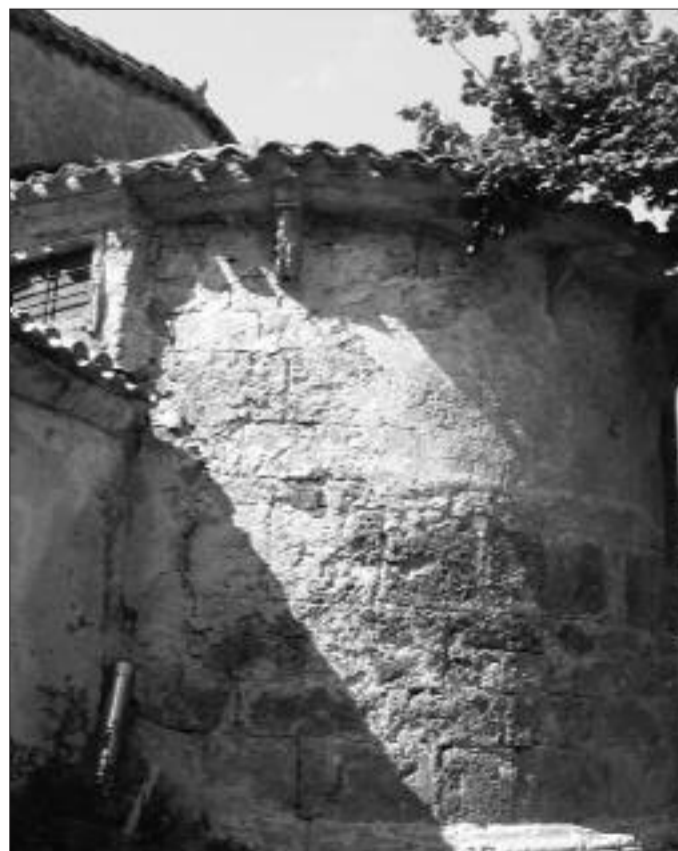
► Ábside románico de la parroquia

El envejecimiento de la población y las nuevas formas de vida han conseguido que Tartalés experimente una alta despoblación en beneficio de Trespaderne, capital del Municipio. No