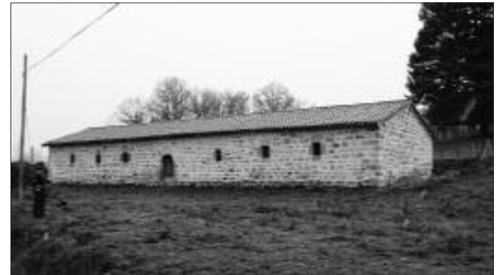
► La Casa de las 7 Villas será un Museo Etnográfico

La Consejería de Cultura y Turismo de la Junta de Castilla y León responde a la solicitud de apoyos para mejorar las infraestructuras turísticas de las Entidades Locales de la Región con la adjudicación de fondos que en Las Merindades benefician a los municipios de Merindad de Sotoscueva, Villarcayo y Valle de Tobalina.