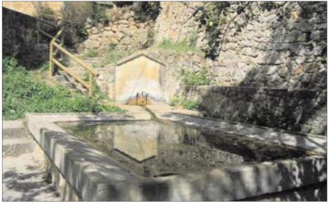
► Lavadero restaurado

27, tras haber quedado en el olvido cuando la fiesta se celebraba el día del Santo sea cual fuere el día de la semana,