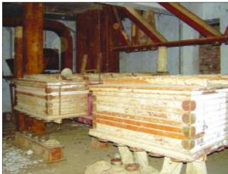
► "Planchister" para cerner el trigo