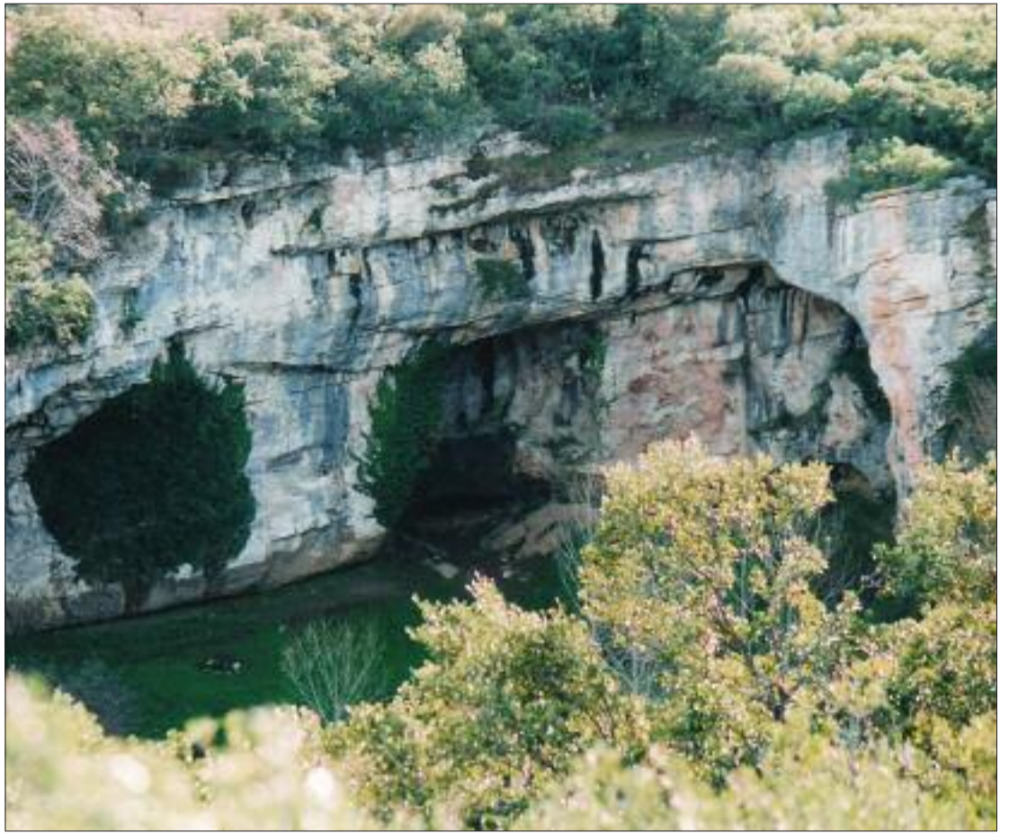
► Entrada a la Cueva de Las Vacas

El cronista ha vuelto varias veces a Piscarciano. El casi fallido plan urbanístico de unifamiliares que se ideó cercano al lugar, no ha sido obstáculo para ello. La última ha tenido como causa principal comprobar las tres fuentes del río Trifón, que por la zona se ubican, de las que algún día