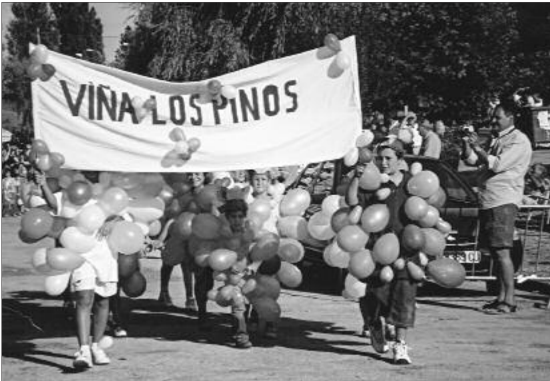
► Los racimos de uva desfilan con decisión en el Concurso de Disfraces

puesto su empeño en resucitar los animados festejos que, en derredor de la festividad de la Asunción de la Virgen, se habían venido celebrando con notoria animación durante muchos años.