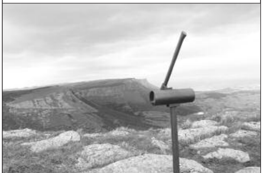
■ Buzón del Arando junto al mirador de Rubén.