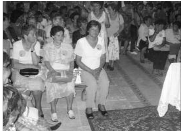
► vista general de la ermita de Santa Bárbara, en Valhermosa de Valdivielso

El padre Rafael, natural de Hoz y destinado en Burgos,