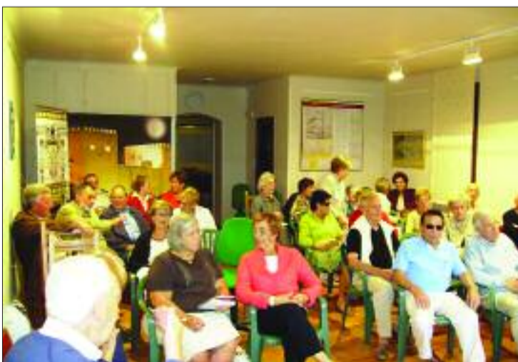
► Sede de los Amigos de Medina antes de la Asamblea General Extraordinaria