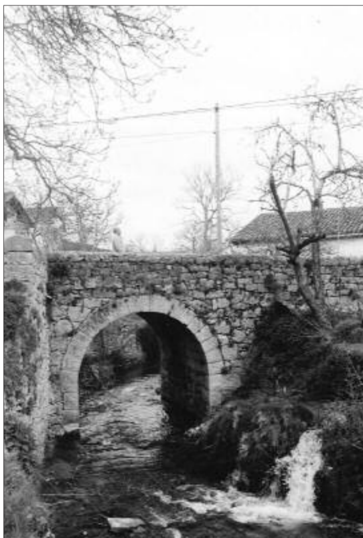
► El río Trifón divide en dos el poblado de Hoz de Arriba

Arenas, así como la sensación de pequeñez existencial que nos transmitió el deambular por el fondo, entonces seco, del barranco, fueron de las que dejan huella y, desde luego, de esas que hacen sentirte inmerso en un ambiente auténticamente mágico.