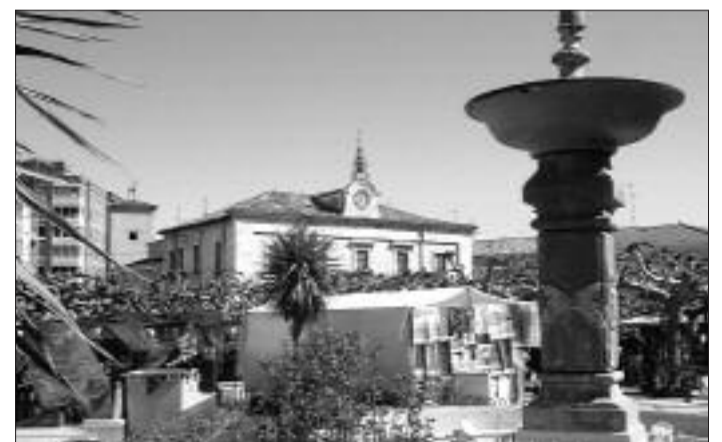
► Villarcayo soterrará los contenedores de residuos sólidos

La segunda intervención en Tobalina consiste en la colocación de señalización y acondicionamiento de la peña Mazo y Popilo. El importe del presupuesto es de 1.668,08 euros, de los cuales la Junta aporta 1.313,61 a razón de 853,85 este año y 459,76 euros el año 2009.