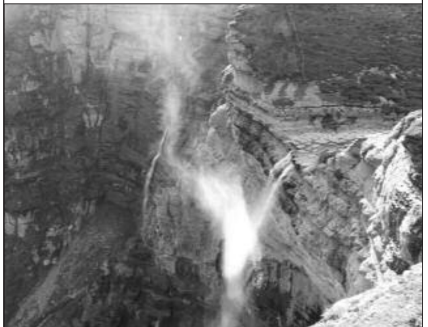
■ Salto del Nervión