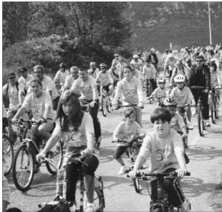
▶ La Fiesta de la Bicicleta congregó a más de medio millar de participantes.

Participaron un total de 544 participantes, desde los 2 hasta los 83 años de edad, y con familias de hasta más de 10 miembros, y con bicicletas de más de 90 años