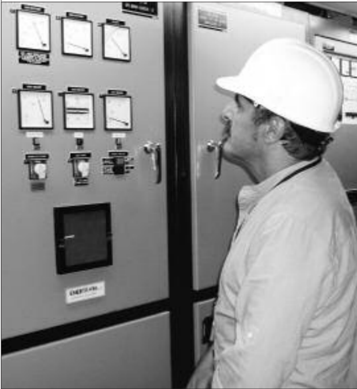
► Un técnico de la central controla un cuadro eléctrico.

■ Nuclenor S. A., empresa explotadora de la central nuclear de Santa María de Garoña, informa que una vez conocido el resultado de la prueba de capacidad de la batería que había sido sustituida dentro de la Unidad Ininterrumpible de Potencia Eléctrica (UPS) de la barra 'B' del sistema de 120 voltios de corriente alterna, y considerando el resultado obtenido en la prueba realizada sobre la batería de la UPS de la barra 'A' el 15 de julio, se contempla que ambas baterías podrían haber presentado simultáneamente una capacidad de funcionamiento inferior a la requerida.