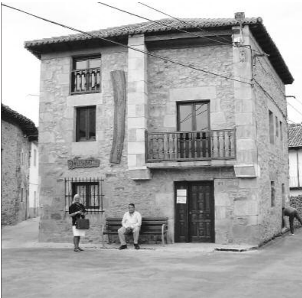
► La Antigua Casa de Concejo de Berrueza se ha convertido en sede del Museo