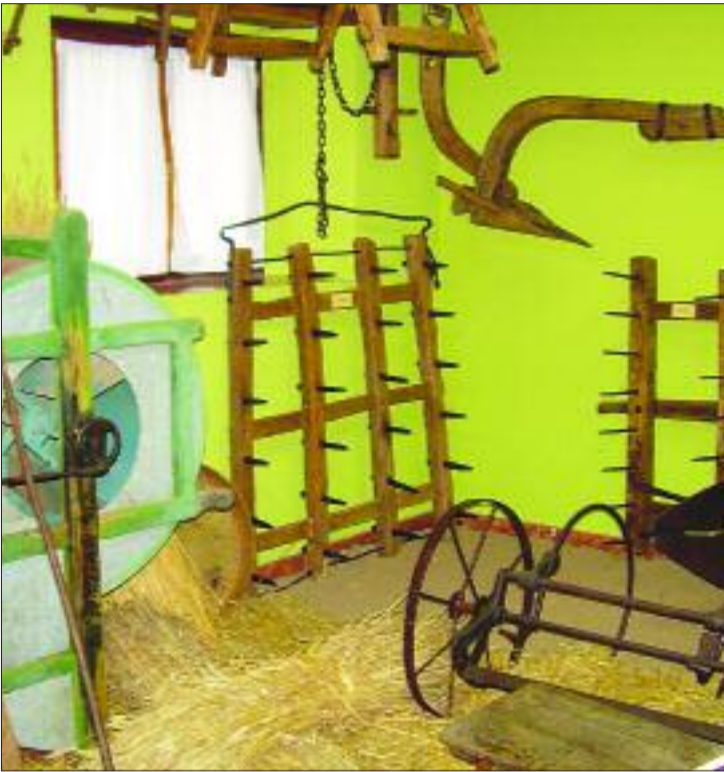
► Aperos de labranza

ramientas habituales utilizadas en el oficio de cortar, preparar y dar forma a la madera.