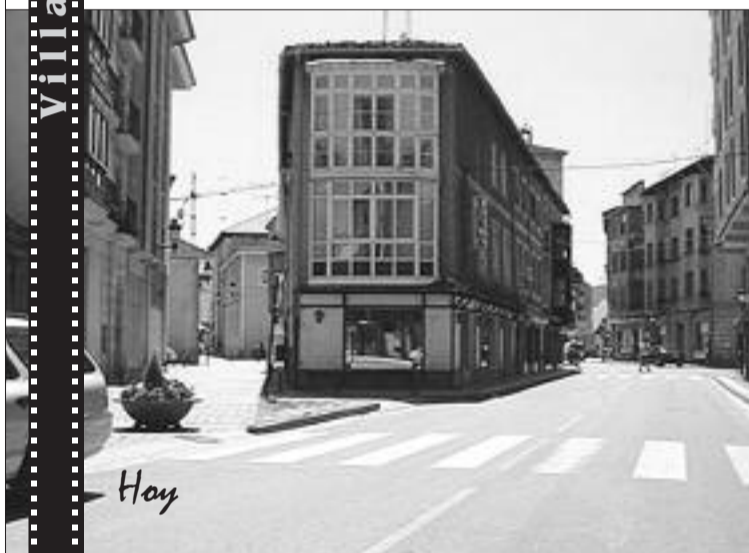
Casa del Bar Tesla en Villarcayo