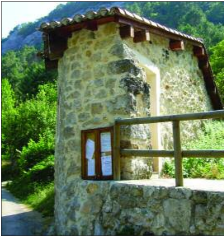
► Horno de cocer el pan

De esta manera, los juegos de bolos "el festejo más importante", dice un vecino, el tute, la brisca, la tuta, el mus, las peñas, las cuadrillas, la misa y la Comida Popular en la que "si hace bueno" se reúnen más de 600 comensales, son el nexo de unión de los vecinos de Trátales con los de la capital. De un tiempo a esta parte la romería se celebra el sábado más cercano al 25 de septiembre, en este caso el