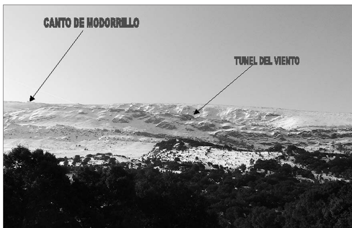
▶ Vista de la Tesla

Solo queda seguir hacia la izquierda por toda la meseta cimera hasta la peña la corva que se encuentra a unos 2 km por el cordal.