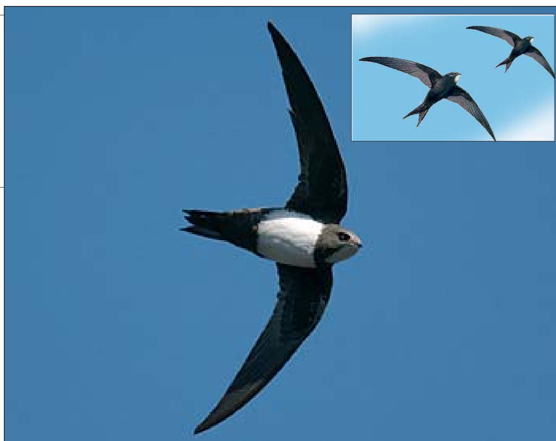
► Vencejo Real

Los vencejos llegan desde África a Las Merindades a finales de Abril-primeros de Mayo y nos abandonan en