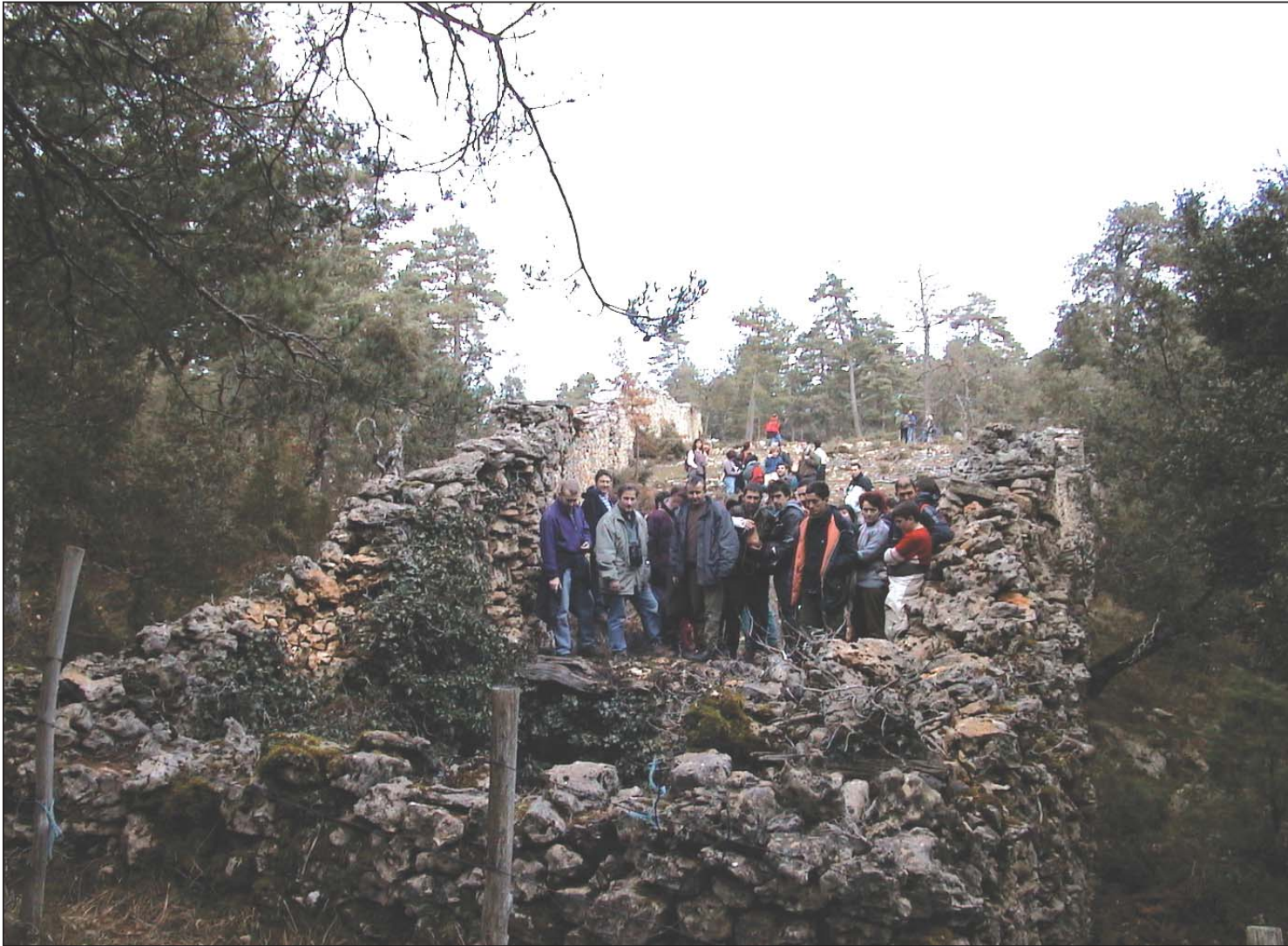
► Lobera de La Barrerilla, en Perex. Un grupo de excursionistas contemplan el foso