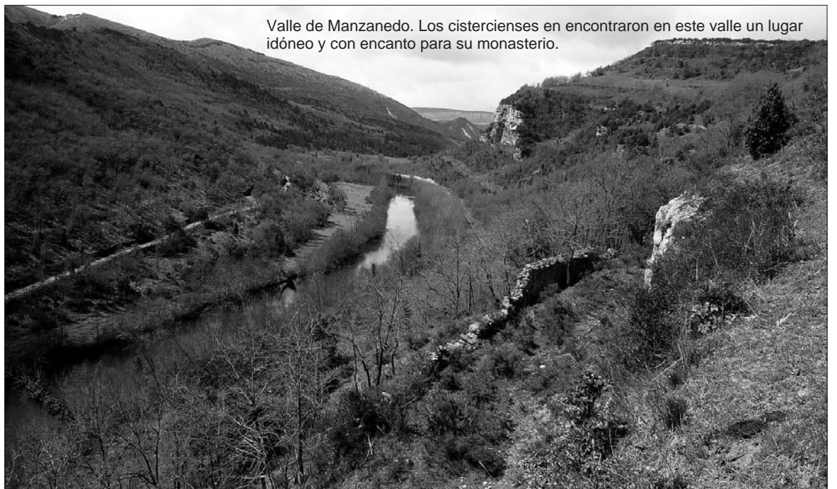
Valle de Manzanedo. Los cistercienses en encontraron en este valle un lugar idóneo y con encanto para su monasterio.

■ Aunque parezca paradójico, hay veces que la desidia, la incuria, el olvido, pueden convertirse en buenos aliados de la arquitectura y de los proyectos de acondicionamiento de edificios y lugares. Este podría ser el caso del monasterio de Santa María de Rioseco, cuyas ruinas, por sí mismas y debido al abandono secular al que se han visto sometidas, constituyen hoy un