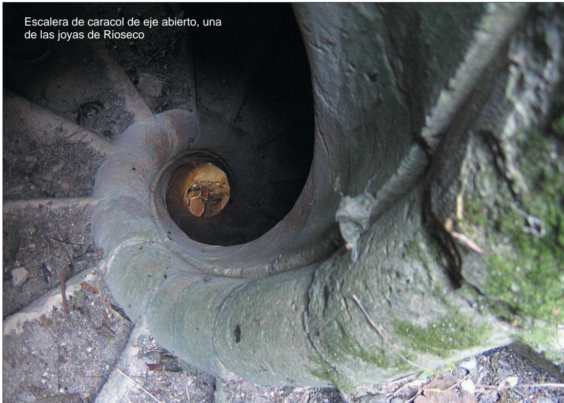
Escalera de caracol de eje abierto, una de las joyas de Rioseco

otros restos, conforman un panorama arquitectónico tan hermoso como desolador. La secular falta de atenciones del cenobio desde la desamortización, y desde que la última familia que vivió en él emigrara hace cuarenta años, han hecho que sea milagroso que aún se conserve lo que se conserva. Quizá el penúltimo milagro de San Bernardo, si es que hubiera hecho alguno.