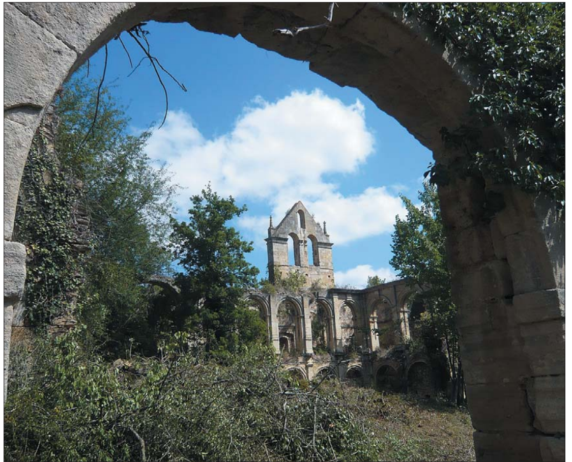
▶ Arquerías y vegetación se unen para crear un espacio romántico de enorme belleza.

"Parque romántico y Jardín Botánico de Santa María de Rioseco"