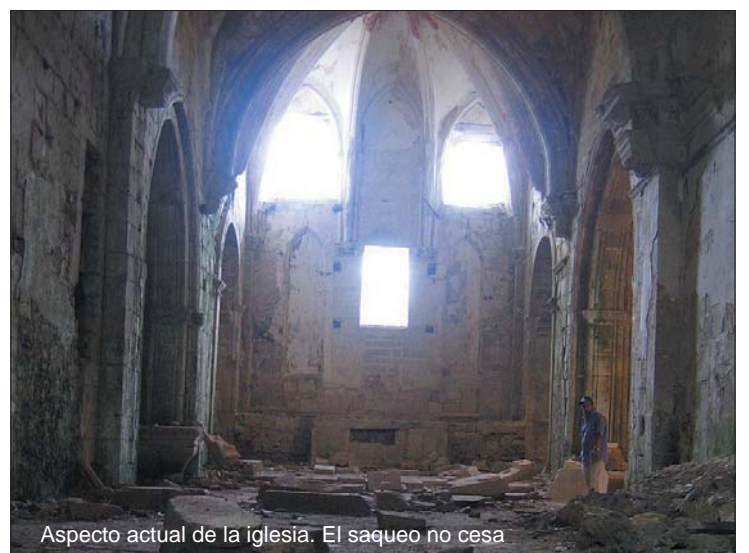
Aspecto actual de la iglesia. El saqueo no cesa