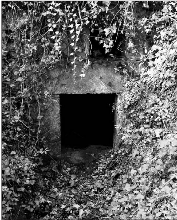
► Acceso a la fuente.

■ Durante las labores de desbroce que miembros de la Asociación Amigos de Rioseco llevaron a cabo recientemente en las ruinas del convento cisterciense de Rioseco, fueron localizados la fuente y canalización de agua que abastecía el mencionado cenobio, ambos de posible origen medieval y de los que no se tenía conocimiento alguno. En lo que se refiere al último elemento, se trata de una conducción de piedra, con su correspondiente rebaje en forma de U, de más de 600 metros de longitud y cubierta con cientos de losas de piedra labradas con forma triangular.