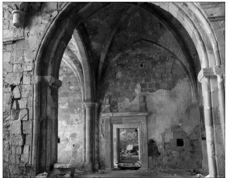
► El arte está presente en cada rincón del monasterio. Un lujo de ruinas que hay que aprovechar.