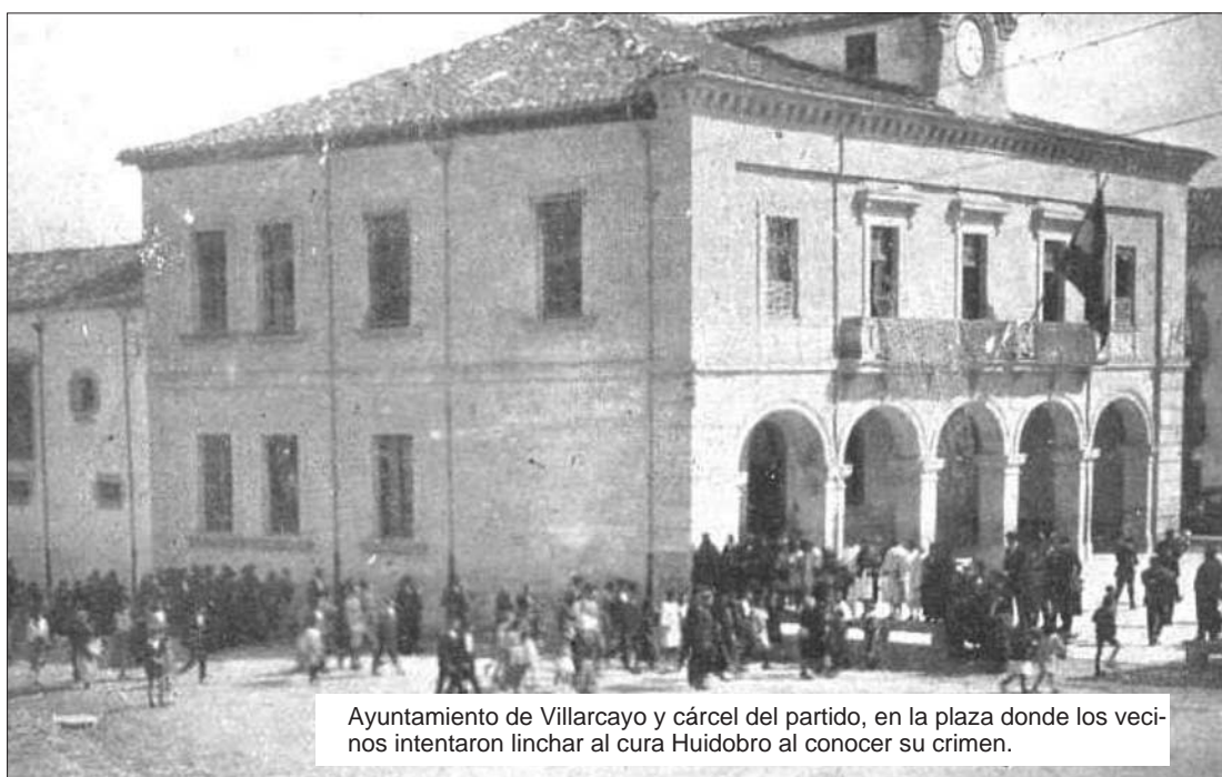
Ayuntamiento de Villarcayo y cárcel del partido, en la plaza donde los vecinos intentaron linchar al cura Huidobro al conocer su crimen.

Luego desfilaron por el estrado algunos familiares de