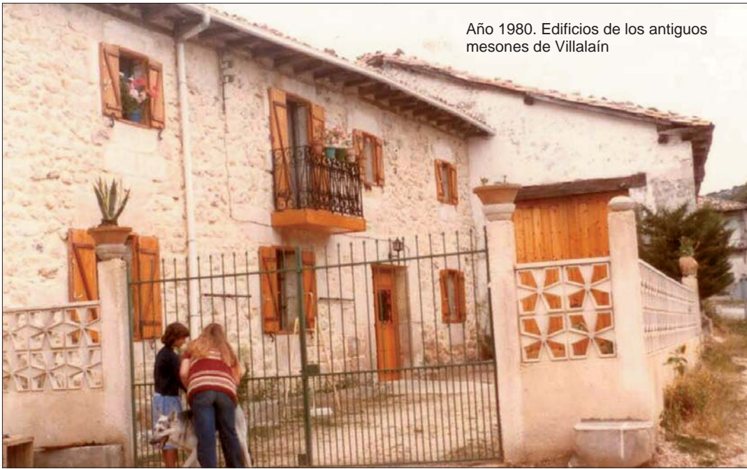
Año 1980. Edificios de los antiguos mesones de Villalaín