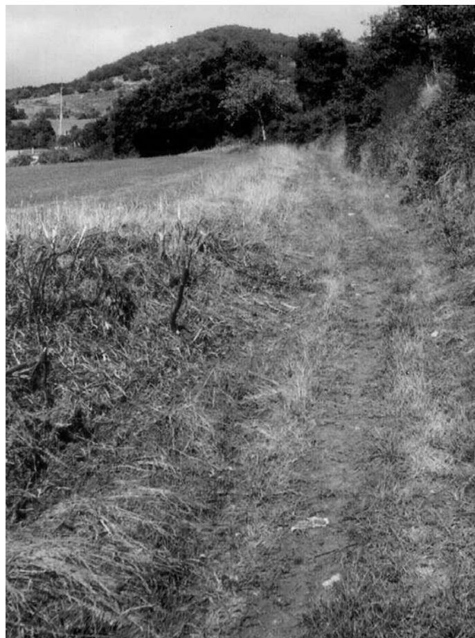
Camino arriero hacia Medina. al fondo las casas de Barruso

La Real Compañía de Carreteros de Tierra de Pinares (Quintanar, Regumiel, Palacios, Canicosa, etc..) traían la lana hasta N o . S a . de la Hoz, junto al Almiñé y desde allí los transportistas de las Merindades en carretas y sobre todo a lomos de caballerías por Puentearenas, Venta Dentro, Venta Fuera, la Hocina, Bisjueces, Medina. Quintani-