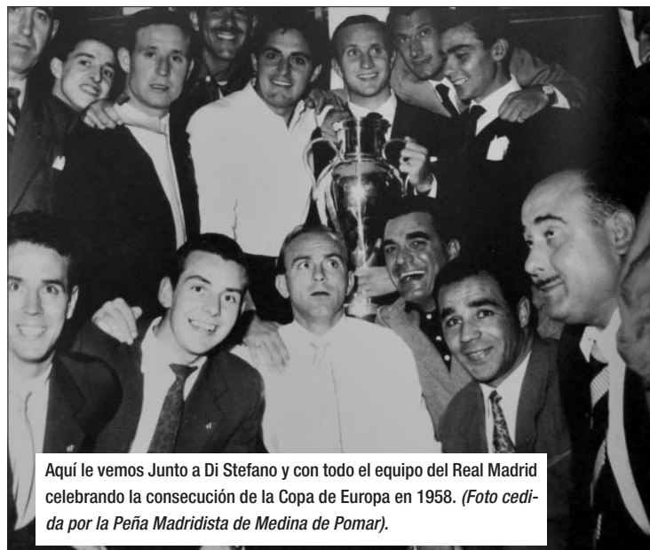
Aquí le vemos Junto a Di Stefano y con todo el equipo del Real Madrid celebrando la consecución de la Copa de Europa en 1958.

ojeador, negociando contrataciones de futbolistas importantes para la primera plantilla del Barça.