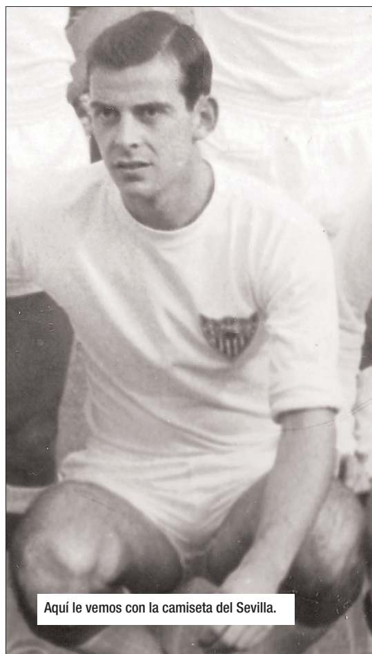
Aquí le vemos con la camiseta del Sevilla.

En la temporada 1961-62 ficharía por el Barcelona pasando 8 temporadas en el equipo de la ciudad Condal dando muchas alegrías a su afición. Después de su carrera como futbolista fue técnico de la Federación Española de Fútbol, entrenado a casi todas las divisiones inferiores e incluso en dos ocasiones dirigió la selección absoluta.