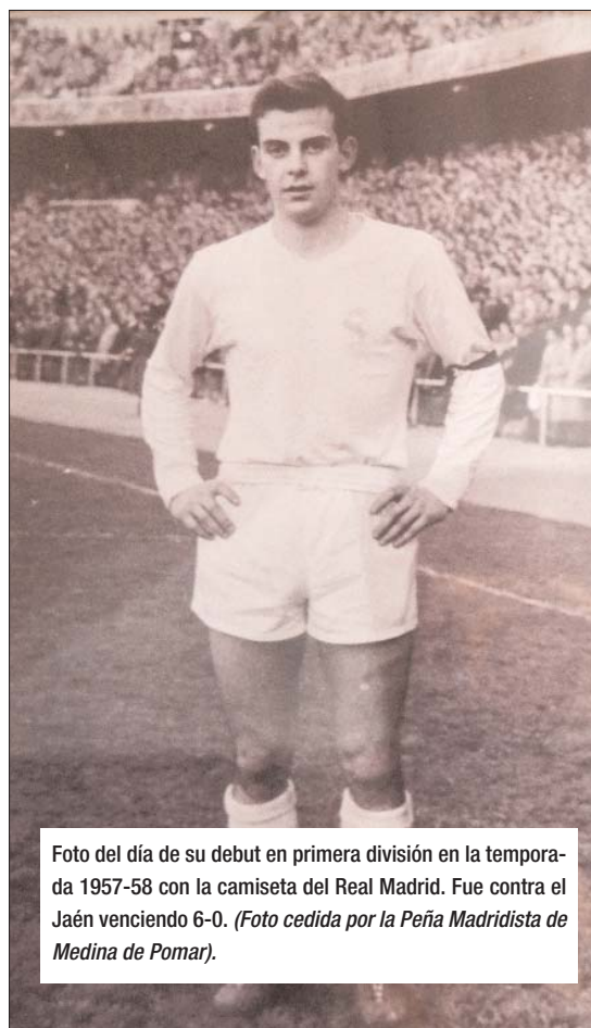
Foto del día de su debut en primera división en la temporada 1957-58 con la camiseta del Real Madrid. Fue contra el Jaén venciendo 6-0.